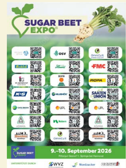
Logo + QR-Code auf der Ausstellerseite in der Zeitschrift