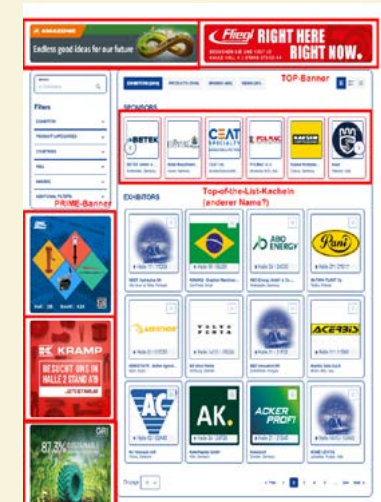
Online-Anzeige im Ausstellerverzeichnis